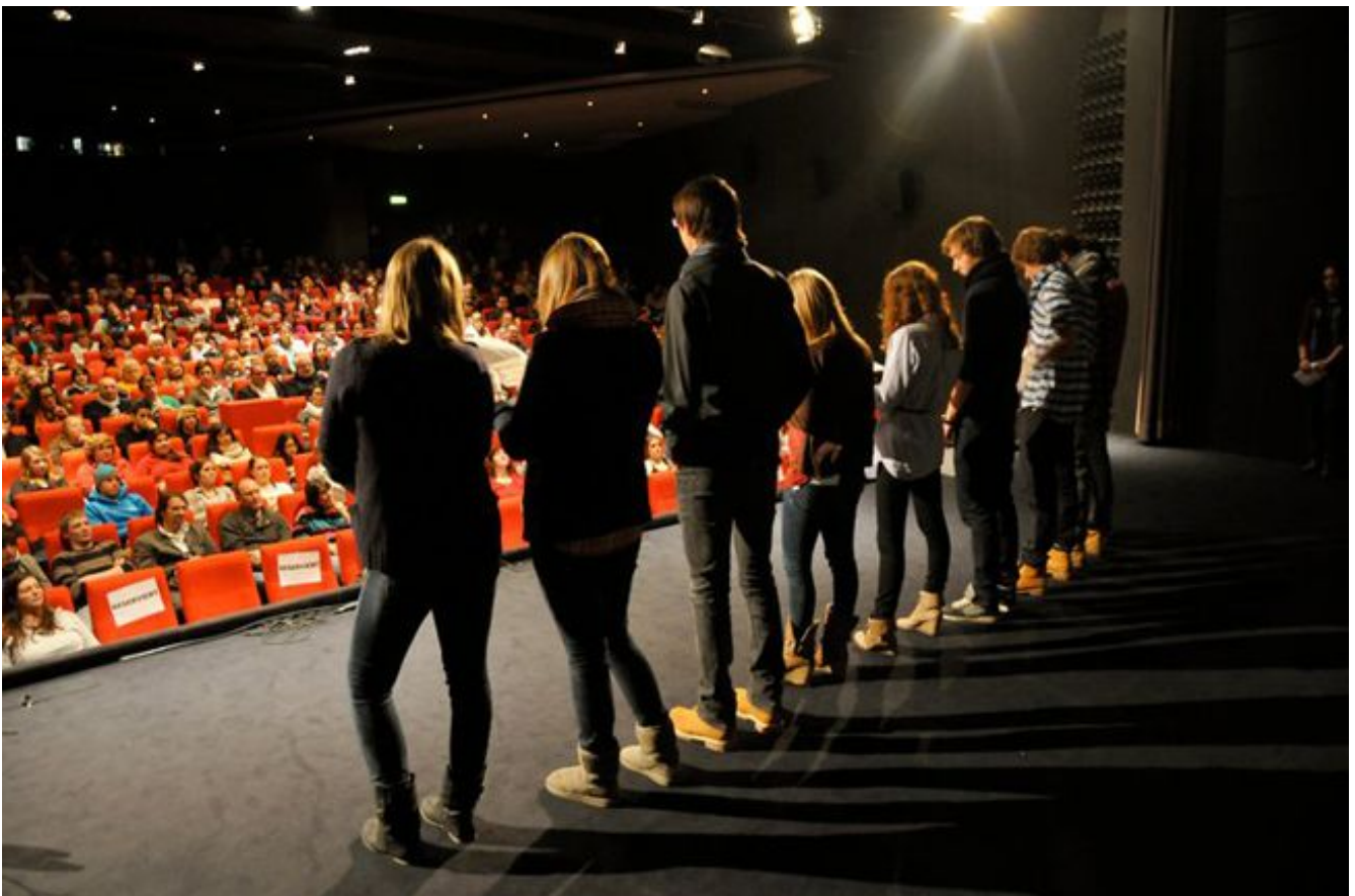
Anschließend wird die gedrehte Szene auf der Leinwand gezeigt