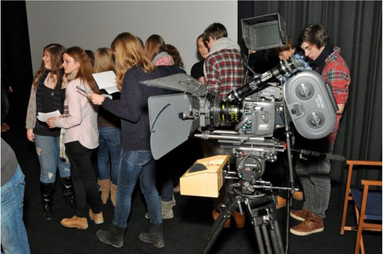
Die Schüler bereiten sich zu ihren Vorträgen über Filmberufe vor