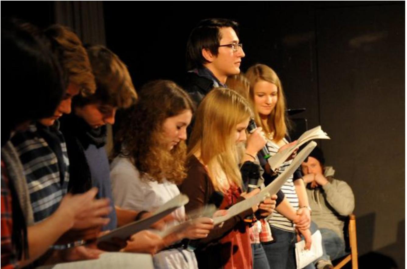
Szenische Lesung mit den Schülern des P-Seminars Film am Maxgymnasium (Dorffestszene)